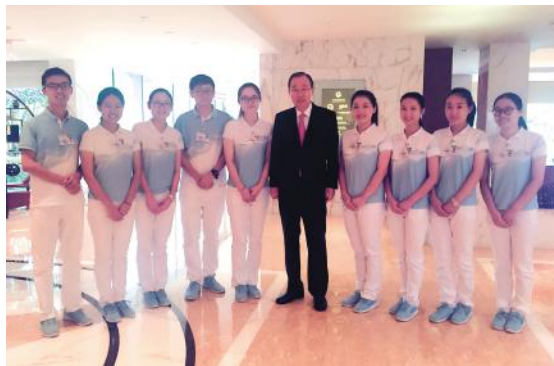
▲我校“小青荷”接待时任联合国秘书长潘基文