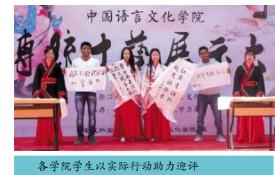
各学院学生以实际行动助力迎评

工作成绩与特色,梳理教学管理制度健全程度,检查试卷、毕业论文(设计)、教研活动记录、听课记录、嵌入式实践周、实习指导记录等所有教学过程材料等教学档案规范情况,查找存在的问题,并制订相应的改革措施。4月16-18日,学校组织校外专家对全校各专业进行了预评估工作,针对专业评估发现的问题,各学院逐一整改落实,补齐短板。