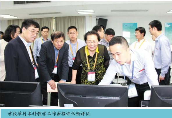
学校举行本科教学工作合格评估预评估

5月9日,校长洪岗来到西语学院了解学院评建工作的开展情况,并进行工作指导。会上,洪岗提出要精准凝练国际化特色,有效落实应用型人才培养方案,深化国际化人才培养特色的凝练。会后,洪岗实地察看了西语学院环境文化建设和走访系办公室,与教师深入交流,要求广大教师在迎评建工作中树立攻坚克难的意识,同时嘱咐老师们保重身体,做到劳逸结合。