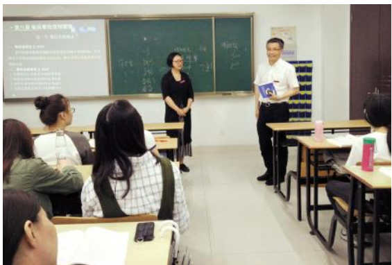
宣勇深入教学一线听课指导

编者按: 本科教学合格评估是对学校办学能力、办学质量、办学水平的重要检阅,关系到学校的发展,关系到每一位浙外人的切身利益。全校上下要从迎评工作这个大局出发,贯彻落实“以评促建,以评促改,以评促管,以评促转,评建结合,重在建设”的指导思想,凝智聚力,一切工作围绕迎评展开,全面推进本科教学合格评估工作。